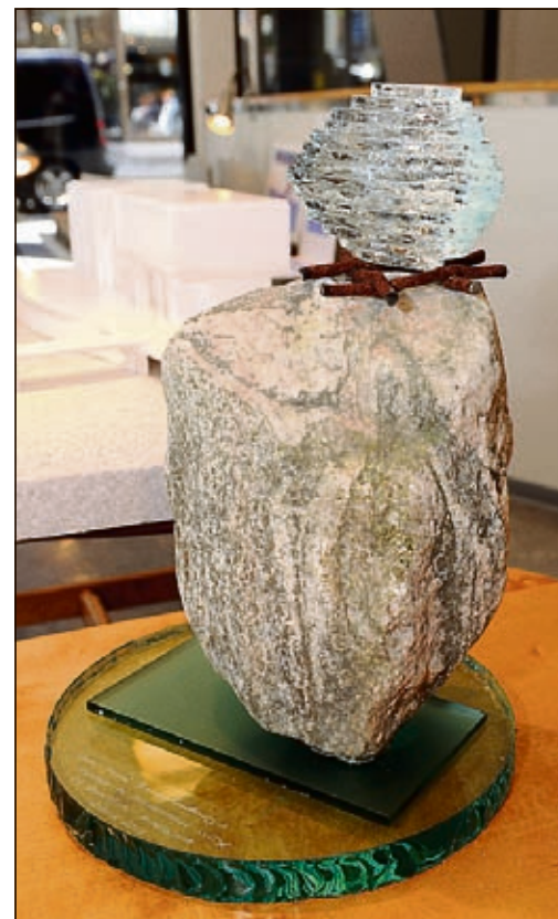
GLASSEGG: Brantenbergs forslag er et glassegg i et rede av jern på en stein.