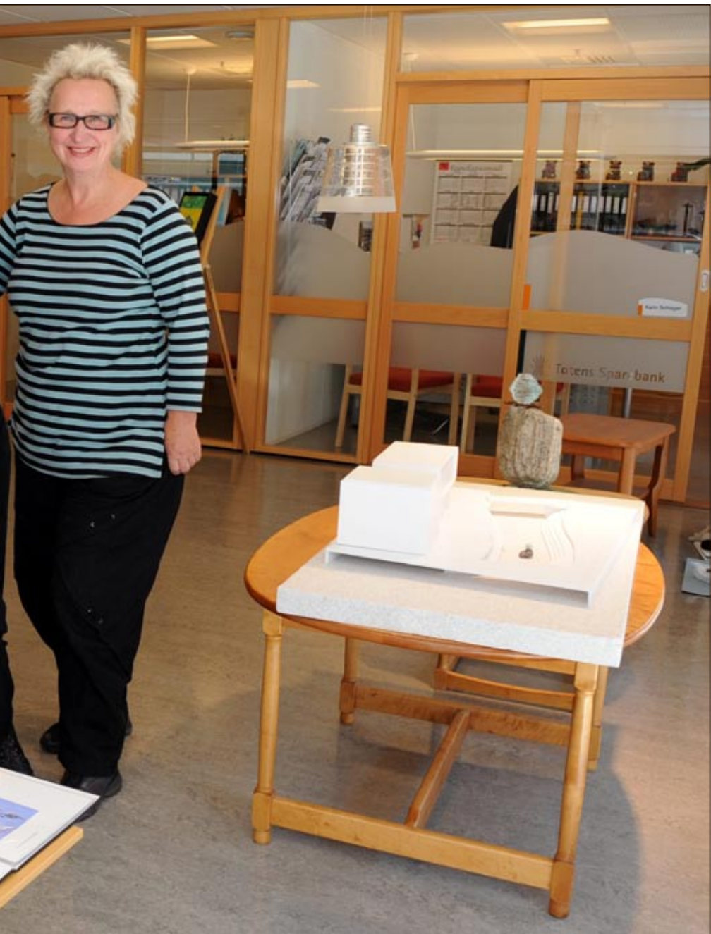
eller av sine skulpturforslag i vinduet hos Totens Sparebank på Gjøvik. Avstemningen starter i dag.